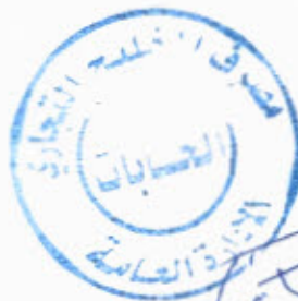
مففر فف القفم المافف شفعاء عبالحمفد عبالرفمن